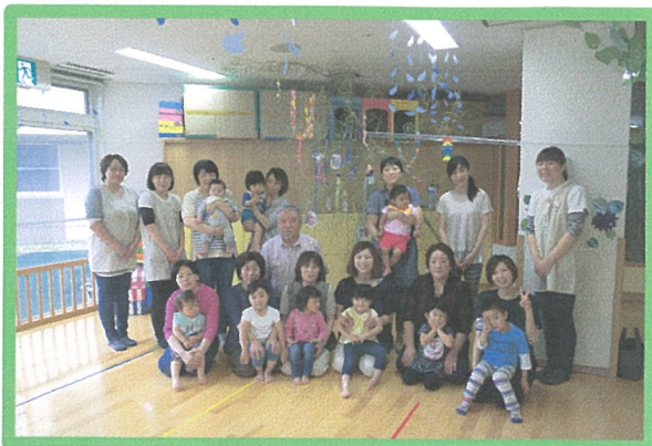
リトミックの交わり ♪ 3つありましたね♪