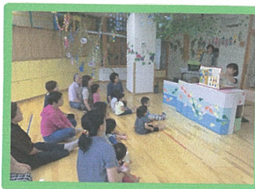
静かに見てくれて、ありがとう♡

去年とれた朝顔の種を植えましたが、発芽までとても時間がかかりました。先日、ようやく花が咲いてくれました。何色の朝顔が咲くのが楽しみです。