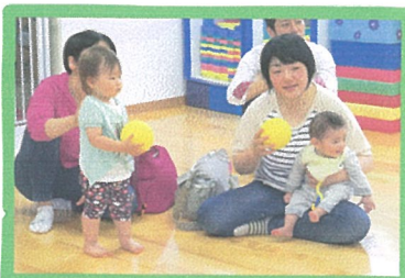
(左は、新入児6か月の環犬(あいた)君です。)

今年度最初の開放に、入所児、新入児、修子児とそのご家族 23名が参加して下さいました。