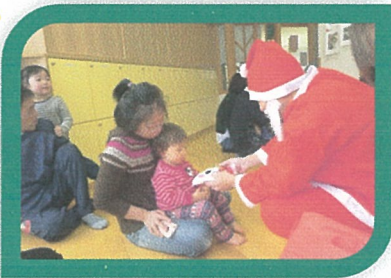
「話し方と目がわたしのお父さんに似てる〜!」と言われましたが、気のせいです... 夕分...