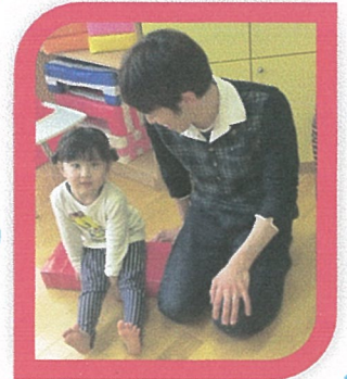
いすとりごっこは、よそのお父さんと、ちよびり耳にすかしかがっ=けれど、仲良しになりました。🐱🐶