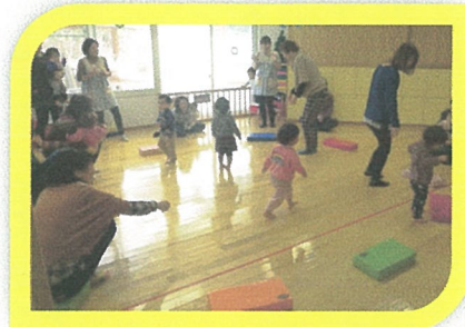
いすとりごっこは、年齢や興味に合わせて、いろいろな楽しみ方ができるあそびです。