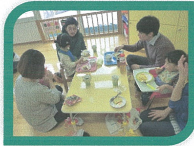
忙しい毎日を送られているお父さん、お母さん、なかなか子どもさんと一緒にゆっくりと食べる時間もとれないというお話を伺うこともあります。