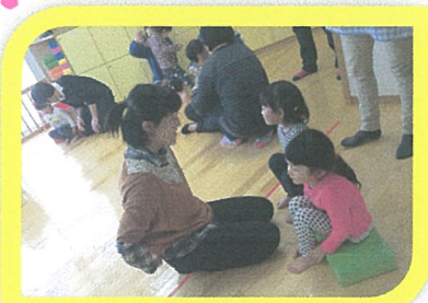
3歳をすぎると、本当にしゃかりしてきます。🌟