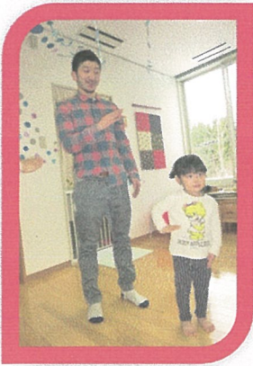
アブラハム体操をお父さん達と一緒に踊りました。「頭」と「お尻」が入ると〜!?

入所児8名、入所児外5名、修了児1名 とそのご家族14名、そしてサンタさん1名の 総勢29名のご参加をいただき、とてもにぎやかに楽しい時間を過ごしました。