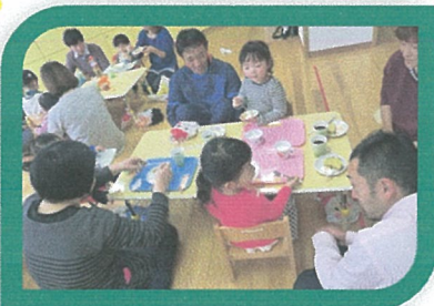
お父さん方、たまには甘い物におつきあい下さい。泣物は夜に...