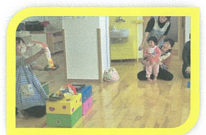
牛乳パックと輪ゴムだけで十分、楽しめちゃうんです♪ ピヨヨヨ〜ン 📞