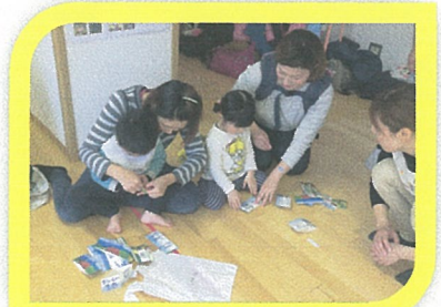
アンパンマンにはらぺこあおむし、キティちゃん、サンタさん、お家でちょうどよい箱、見つかりましたか?!